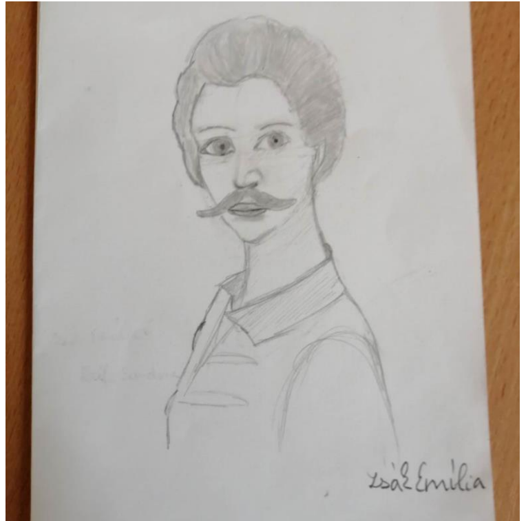
Illusztráció: Zsák Emília 6. a

Kétszáz éve jött a világra, S egyből fellángolt a tudása. Útja során harcolt, költött, Verseivel szabályt döntött. Mostanra már emlék ő, De minden munkája kitűnő. Sokat köszönhetünk neki, Ezért imádja őt mindenki.